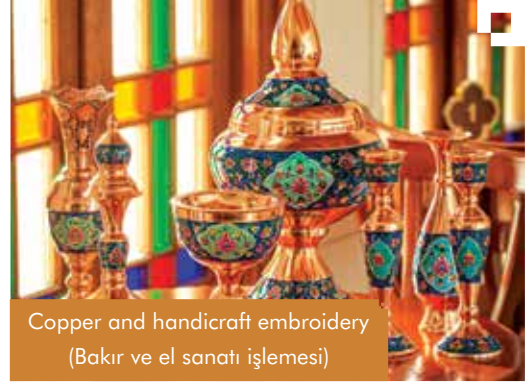
Copper and handcraft embroidery (Bakır ve el sanatı işlemesi)

A precious woven fabric of the delicate fiber which is one of the exquisite textile crafts of Iran. From two series of Warp and woof, there is a density of woof on the back of the fabric. It is made of wool or silk with genuine Iranian designs.