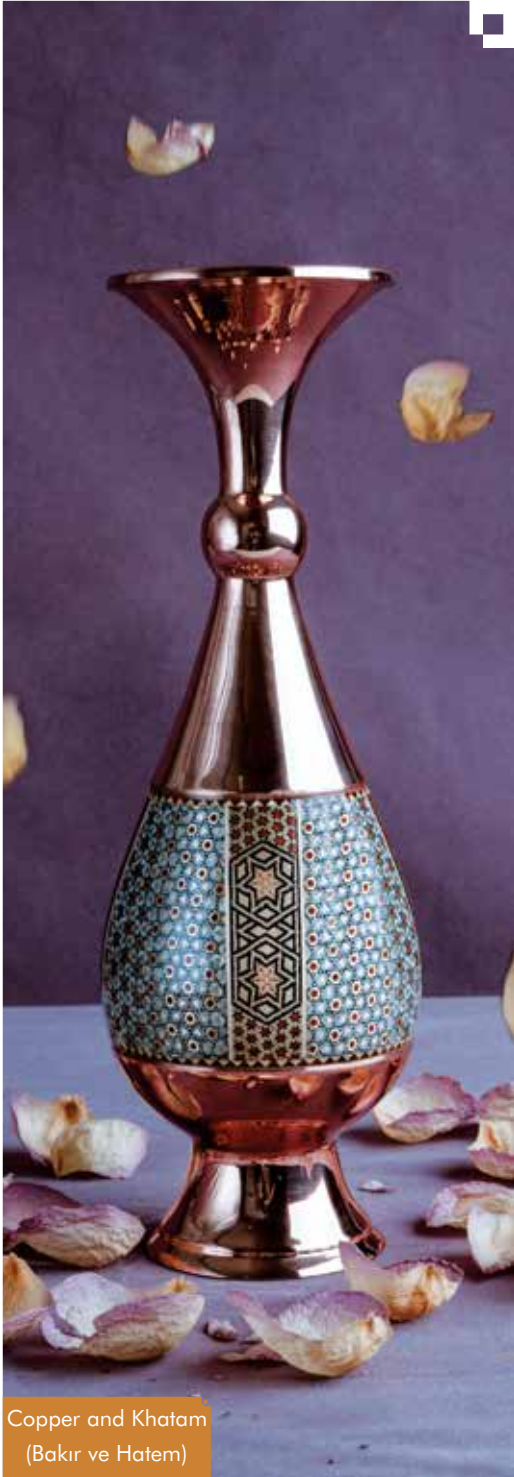
Copper and Khatam (Bakır ve Hatem)