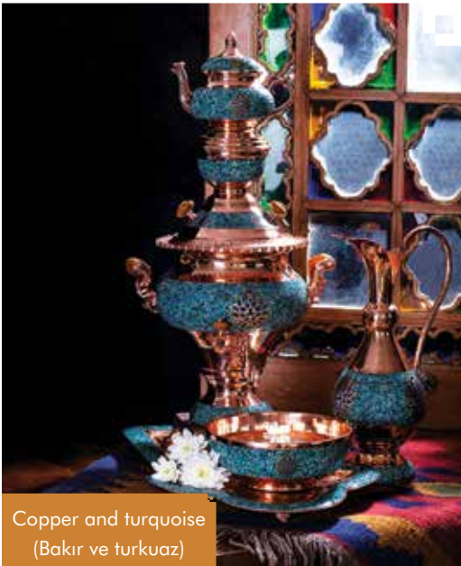
Copper and turquoise (Bakır ve turkuaz)