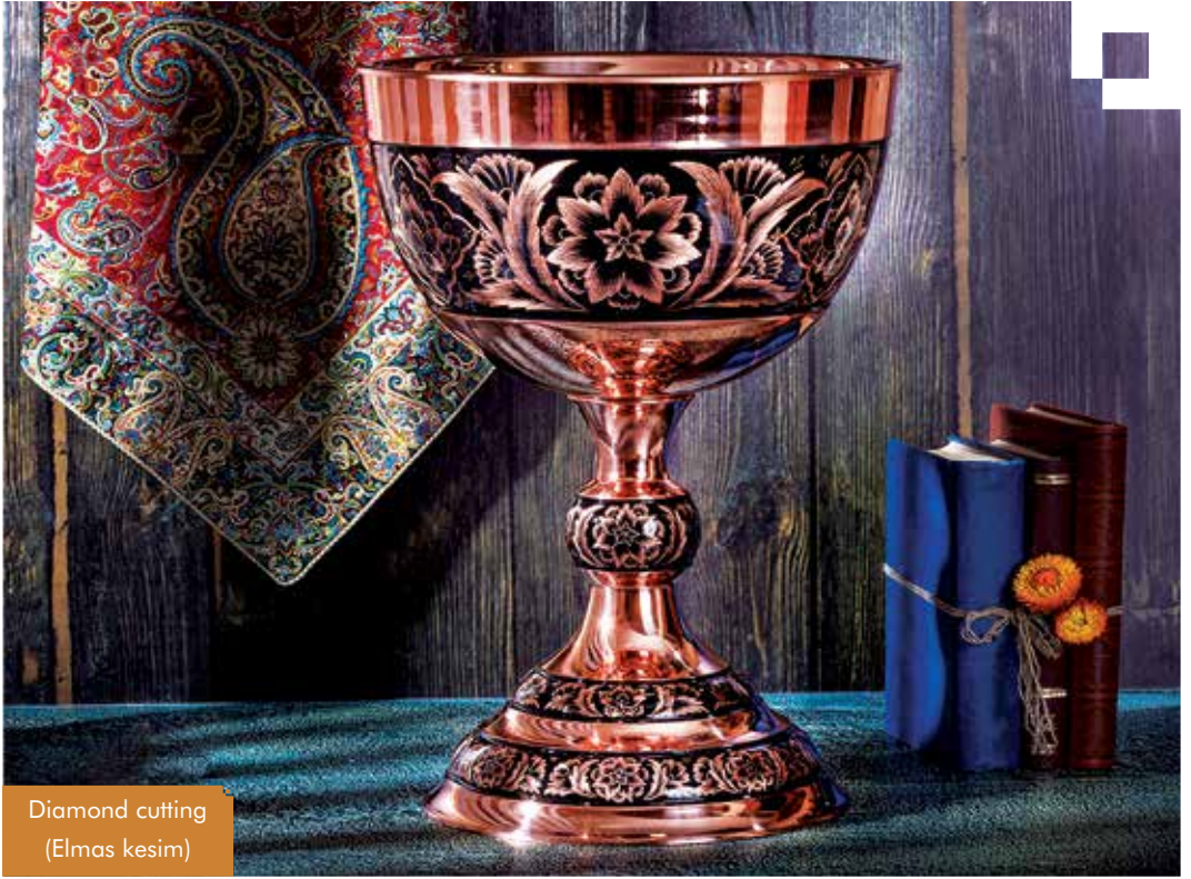
Diamond cutting (Elmas kesim)