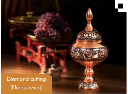
Diamond cutting (Elmas kesim)