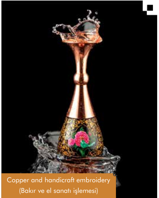
Copper and handicraft embroidery (Bakır ve el sanatı işlemesi)